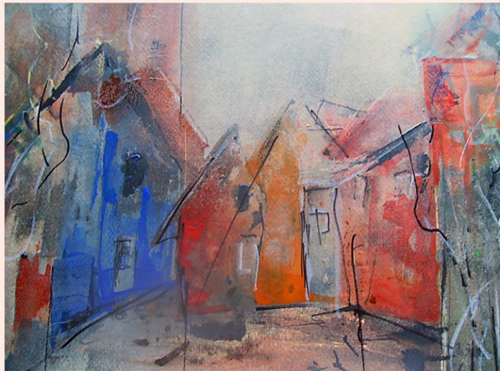
Hilke Deutscher, Sehnsucht nach Freiheit , 2020, Aquarell, 40 x 45 cm